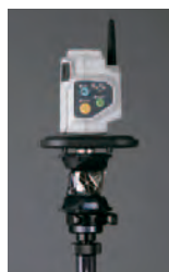
● ATP1 プリズム (ボール用)

6個のプリズムで構成される360°プリズムは、SOKKIA独自の設計。通常のプリズムと同等の高い観測精度を実現します。